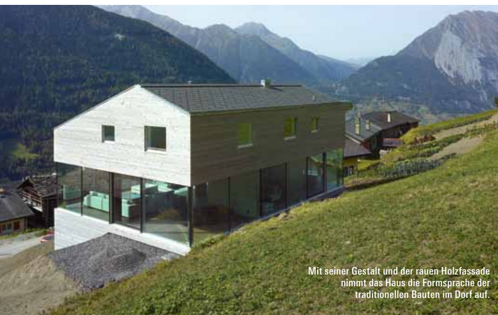
Mit seiner Gestalt und der rauen Holzfassade nimmt das Haus die Formsprache der traditionellen Bauten im Dorf auf.

Wir haben uns enorm gut verstanden. Er hatte ein sehr offenes Ohr und viel Vertrauen in mich. Die Zusammenarbeit bestand nicht darin, dass ich Vorschläge machte und ihn von diesen zu überzeugen versuchte. Wir diskutierten und suchten gemeinsam nach den besten Lösungen. Darum ist es heute auch gar nicht möglich zu sagen, wen man als «Vater» des Hauses bezeichnen könnte. Spannend war für mich, dass der Bauherr sehr offen war für Extravagantes und keine Angst vor Experimenten hatte. Manche Gestaltungsideen, die ich selbst als relativ gewagt empfand, nahm er richtig begeistert auf und trieb sie noch mehr auf die Spitze.