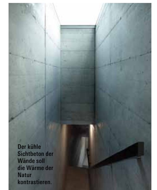
Der kühle Sichtbeton der Wände soll die Wärme der Natur kontrastieren.