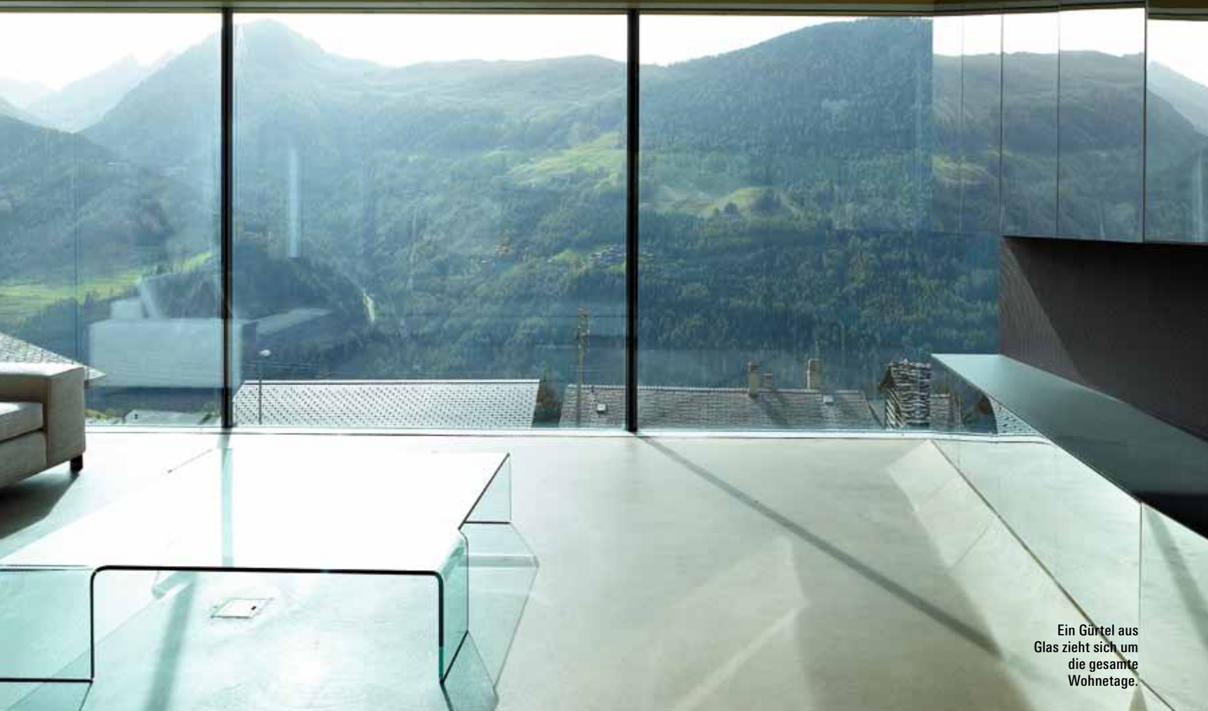
Ein Gürtel aus Glas zieht sich um die gesamte Wohnebene.