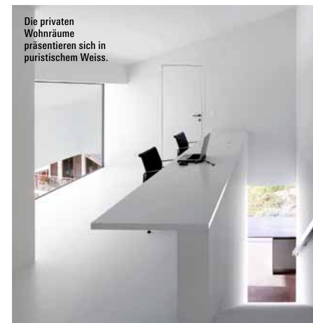
Die privaten Wohnräume präsentieren sich in puristischem Weiss.

er sich hier allemal. Denn das Volkslied «Chum ins Wallis» hat zweifelsohne recht. Im Wallis, wo die Berge nahe sind und die Gletscher in der Sonne glitzern, ist man stets willkommen. Ganz besonders wenn man sich hier – wie der Bauherr dieses Hauses – sein individuelles Daheim und Traumhaus geschaffen hat. ©