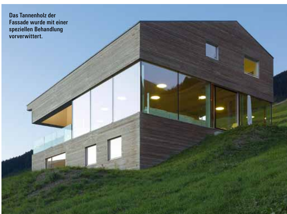
Das Tannenholz der Fassade wurde mit einer speziellen Behandlung vorverwittert.

Wen der Weg heute vom Mittelland ins Wallis und in das idyllische Dörfchen im Val d'Entremont führt, der erkennt leicht, dass die Zusammenarbeit bei diesem Haus-Projekt fruchtbar war. Von aussen dominieren zwei Baustoffe die Optik des Gebäudes: Einerseits Tannenholz, das speziell behandelt wurde, um ihm ein vorverwittertes, natürlich graues Aussehen zu verleihen. Nun wird es gewöhnlich weiter altern und nachdunkeln – genau wie die umliegenden Scheunen. Andererseits wurden die Glasfronten im mittleren Stockwerk tatsächlich so grosszügig eingesetzt, dass das Haus je nach Blickwinkel fast durchsichtig erscheint. Mit seinem «Gürtel» aus Glas will das Haus einen Unterbruch in der Landschaft möglichst vermeiden. Es ist betont transparent und nimmt Rücksicht auf die Harmonie der Walliser Natur. «Die Umgebung war ausschlag-